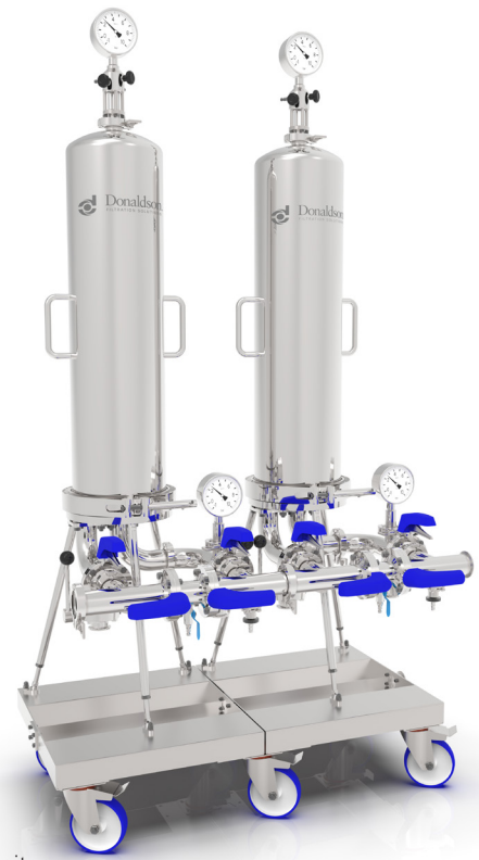
Die Abbildung zeigt ein Modul mit 2 Einheiten