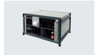
Filter Test Center (FTC)