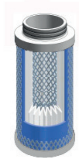
Querschnitt durch den Tiefenfilter