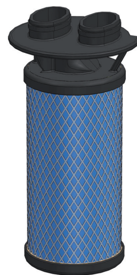
Tiefenfilter UltraPleat® M