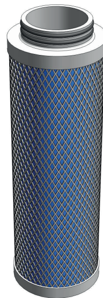
Tiefenfilter UltraPleat® FFP