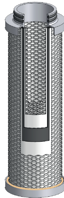
Querschnitt durch den Tiefenfilter AK

Die spezifizierten Leistungsdaten zur Erzielung der Druckluftqualitätsklassen nach ISO 8573-1 wurden nach ISO 12500-2 validiert.